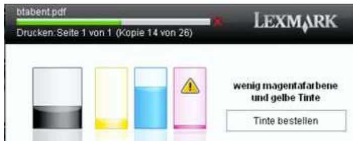
Zweite Warnmeldung über deutlich niedrigen Tintenfüllstand

Bei der zweiten Warnmeldung über einen geringen Tintenfüllstand erscheint am PC die Meldung: „Wenig magentafarbene und gelbe Tinte“. Drückt man also nach der ersten Meldung weiter, erscheint am PC in der jeweilig zur Neige gehenden Tinte ein gelbes Ausrufezeichen. Die nächste Warnmeldung, die bzgl. des Tintenfüllstandes am Gerät angezeigt wird, ist folgende:“ Tintenfüllstand magenta ist sehr gering“. Der Drucker druckt dennoch weiter und der Füllstandsstatus wird im Gerät weiterhin angezeigt.