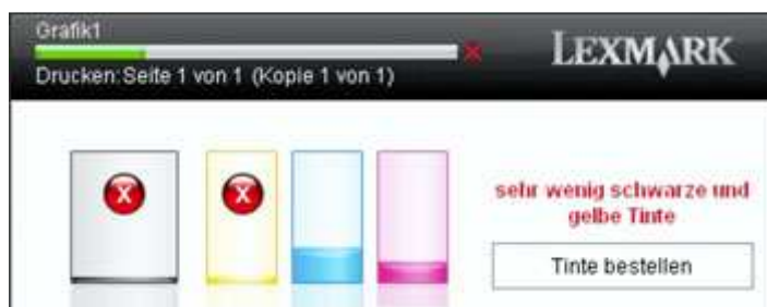
Statusanzeige Tintenpatronen Lexmark 100 sind leer

Tipp: Sollten die wiederbefüllten Lexmark 100 A, 100 XLA Patronen leer werden und auf den Ausdrucken deutliche Streifen zu sehen sein, brechen Sie den Druck direkt ab, da sonst der Druckkopf überhitzt und so Schaden nehmen kann.