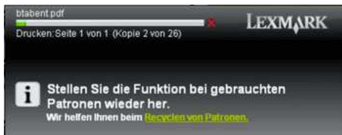
Link zum Recyclen der Lexmark 100 Tintenpatronen

Nach der zweiten Warnmeldung bzgl. des geringen Tintenfüllstandes, wird ein Link zum Recyclen der Lexmark 100 Tintenpatronen an Ihrem Bildschirm angezeigt.