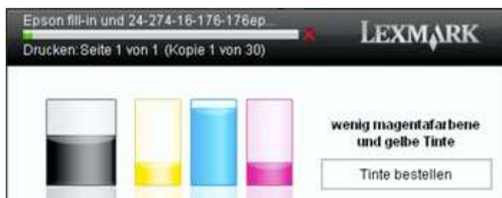
Statusanzeige deutlich geringer Füllstand

Sollte der Tintenfüllstand einer oder mehrerer Tintenpatronen deutlich weniger werden, so werden Sie mit folgender Meldung gewarnt: „wenig magentafarbene und gelbe Tinte “. Auf dem Gerätedisplay wird zusätzlich noch „Tintenfüllstand für magenta ist gering, gelb ist gering“ angezeigt. Bevor man mit niedrigem Füllstand weiter drucken kann, muss man den Füllstandstatus am Gerät mit „ok“ quittieren. Drückt man weiter, wird die Statusmeldung über den Tintenfüllstand im Druckerdisplay nicht mehr angezeigt. Hat man die Warnmeldung über den Tintenfüllstand der Lexmark 100 A, 100 XLA Patrone einmal quittiert, druckt er weiter.